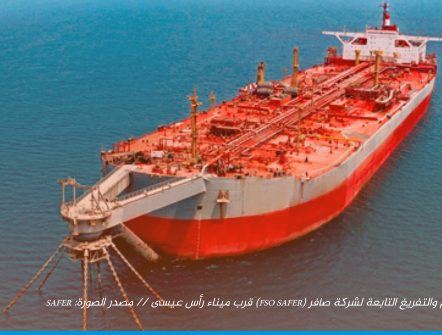
ناقلة التخزين العائم والتفريغ التابعة لشركة صافر (FSO SAFER) قرب ميناء رأس عيسى