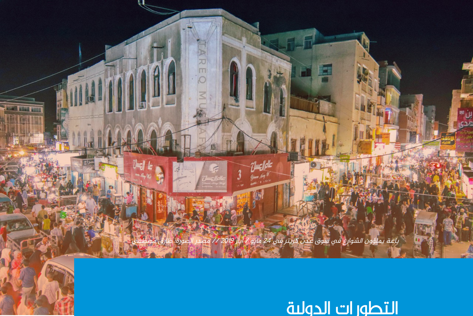
باعة يملؤون الشوارع في سوق عدن كريتر في 24 مايو / أيار 2019