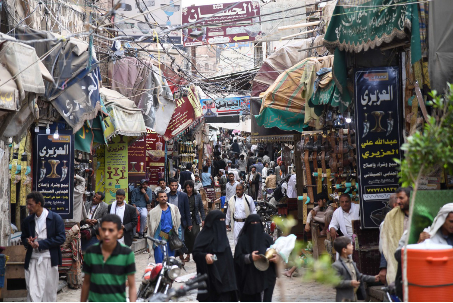
سوق الملح في مدينة صنعاء القديمة في 8 مايو / أيار 2019

انتهت المحادثات دون أي اتفاق يتجاوز الالتزام بالاجتماع مرة أخرى. (من أجل تحليل كامل، انظر ما نشره مركز صنعاء مؤخراً بعنوان صيام موصول: ماذا يعني فشل اجتماعات عمان بالنسبة لليمن).